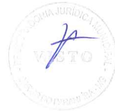
CÉSAR CAETANO DE ALMEIDA FILHO PREFEITO MUNICIPAL

Carmo do Paranaíba, 10 de março de 2017.