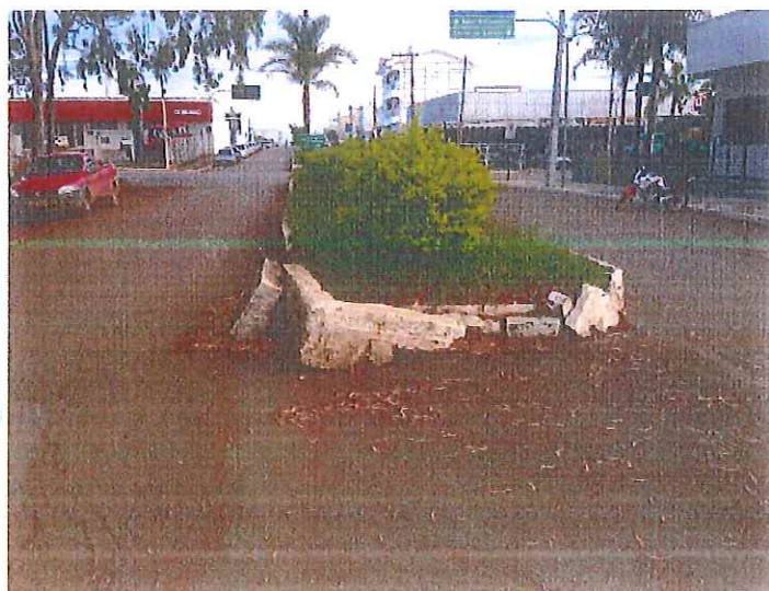
Canteiro central da Avenida das Mansões, no entroncamento com a Av. João Batista da Silva