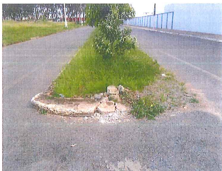
Canteiro central da Avenida, continuação da Rua Lenheiros!