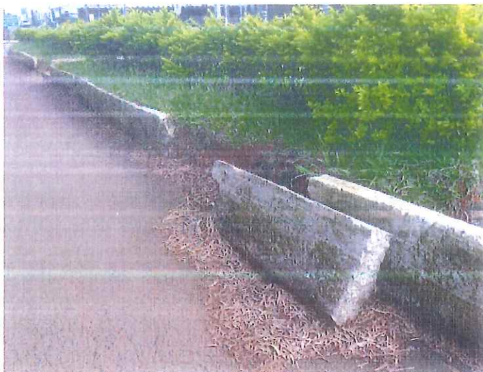
Canteiro central da Avenida das Mansões!